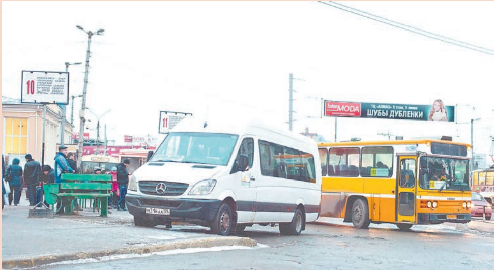
Хуже всего дела обстоят с автоперевозками: в 2014 году количество пассажиров автобусов снизилось на 17%

Динамика отрасли связи в 2014 году также замедлилась. Объём работ и услуг в действующих ценах (не очищенный от инфляции), выполненных организациями связи, к 2013 году увеличился на 102,9%. Годом ранее темп роста составлял 106,3%.