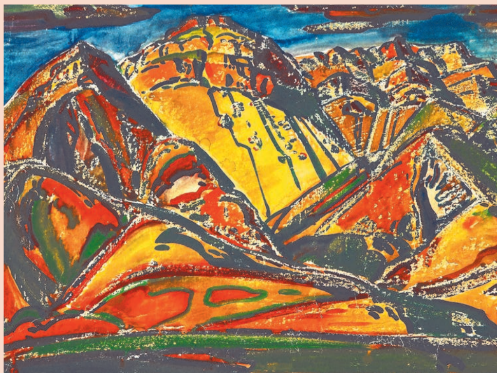
Горы Дагестана, 1969 год