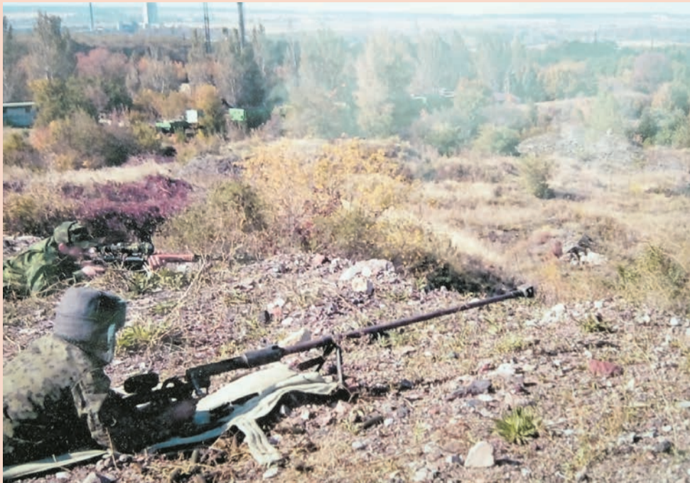
Бывает, что между воюющими сторонами не больше квартала, иногда армии стоят на расстоянии полутора-двух километров

чуть ли не половину Украины. Но местным жителям не нравится, что их заставляют говорить, писать только на украинском. Люди говорят, что выбирают русскую культуру.