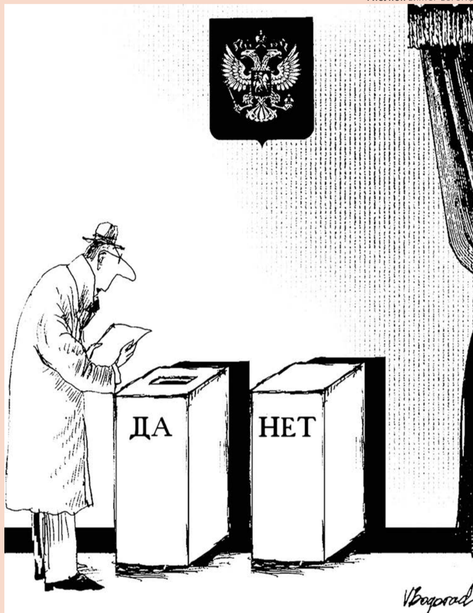
РИСУНОК ВИКТОР БОГОРАД

Однако березниковскую историю могут затмить выборы в скромном и спокойном Верещагинском районе. Дело в том, что из всего списка кампаний 2015 года только здесь на выборах будут партийные списки, а значит, и прямые оценки рейтингов партий. Цифровые показатели «Единой России» — это всегда индикатор стабильности ситуации в регионе. Можно прогнозировать, что внимание администрации губернатора