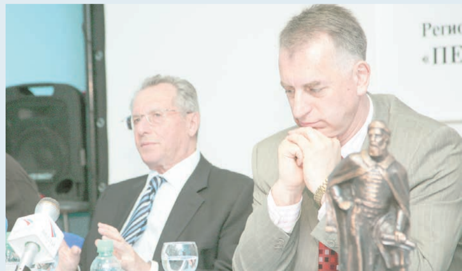
Правление Пермского землячества считает, что около 100 номинантов на премию — это оптимальная цифра