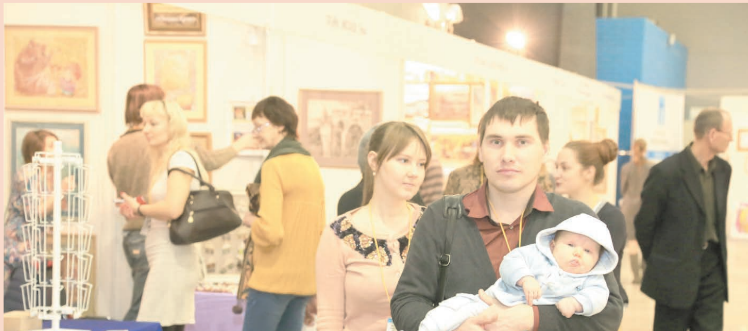
На «Арт-Перми» много некрасивого, смешного, наивного, но не хочется над этим издеваться, потому что это феноменально посещаемая выставка