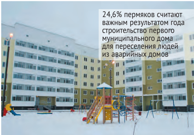
24,6% пермяков считают важным результатом года строительство первого муниципального дома для переселения людей из аварийных домов