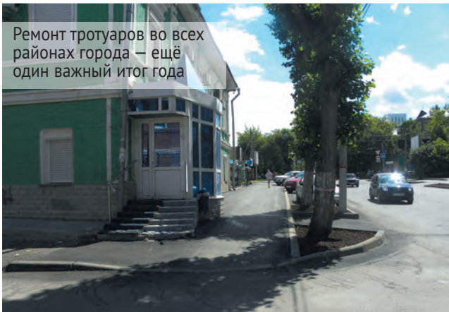
Ремонт тротуаров во всех районах города — ещё один важный итог года