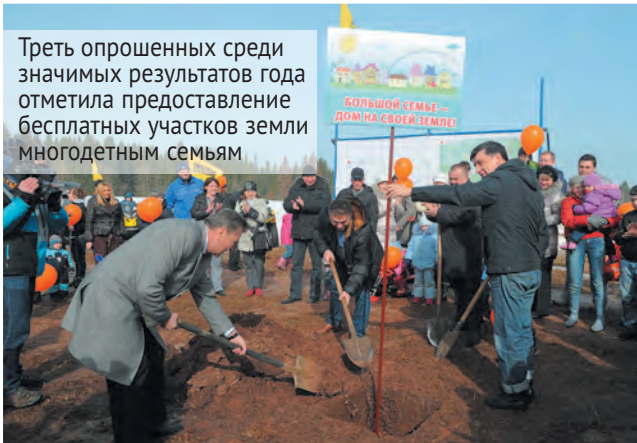
Треть опрошенных среди значимых результатов года отметила предоставление бесплатных участков земли многодетным семьям