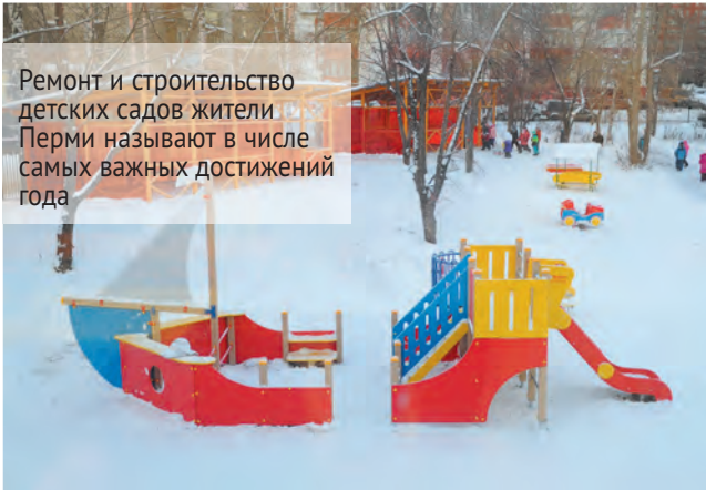
Ремонт и строительство детских садов жители Перми называют в числе самых важных достижений года

Более 53% пермяков настроены на будущий год оптимистично и ожидают положительных изменений в городской среде.