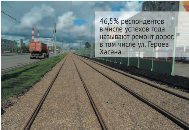
46,5% респондентов в числе успехов года называют ремонт дорог, в том числе ул. Героев Хасана