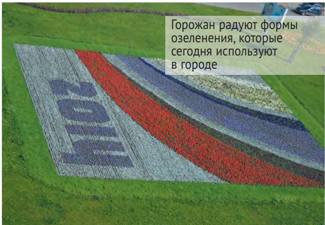
Горожан радуют формы озеленения, которые сегодня используют в городе