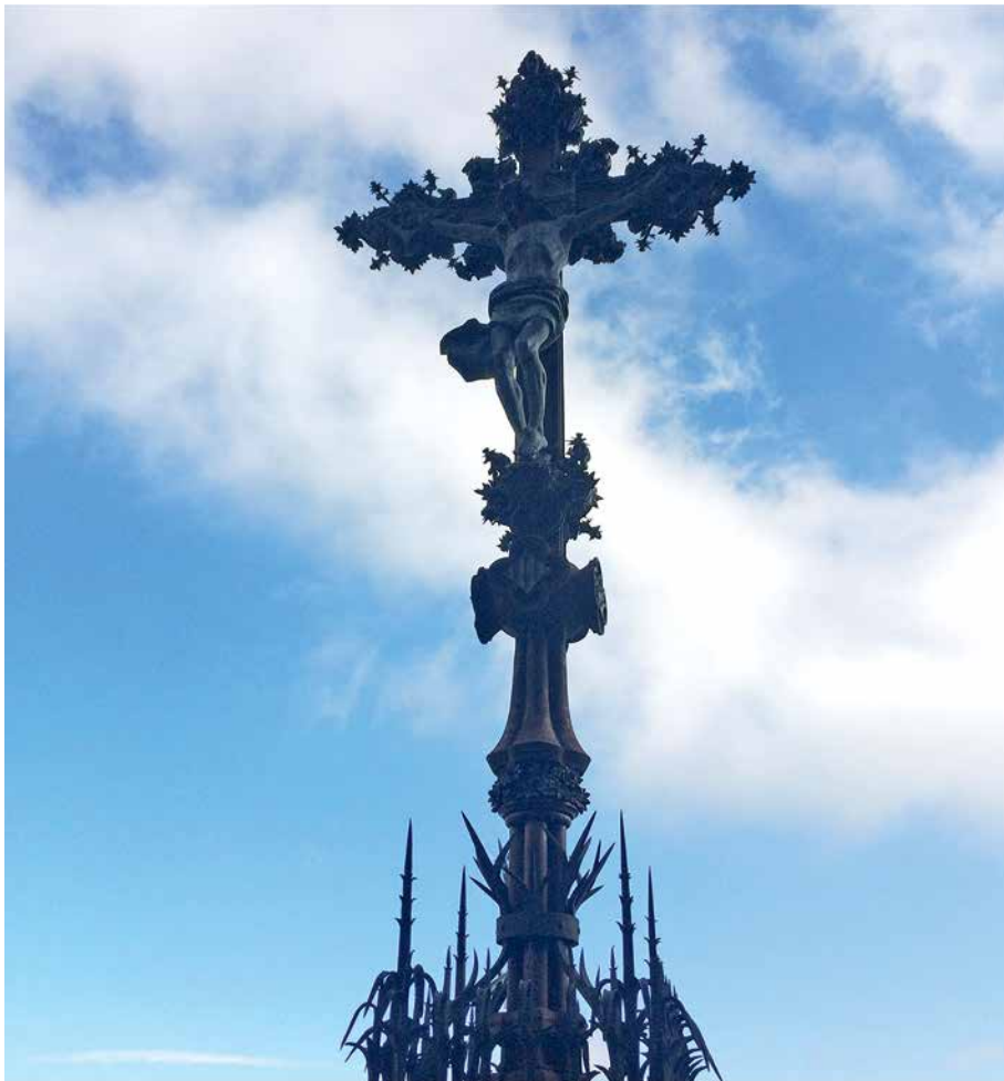
На Пути молитв

В начале XX века именно по этой тропе к пещере были установлены архитектурные группы наиболее известных художников каталонского модернизма — Антонио Гауди, Жузепа Льиомоны, Пуч-и-Кадафалка. Общей темой для всех художников стали эпизоды из жизни Иисуса Христа и Богородицы.