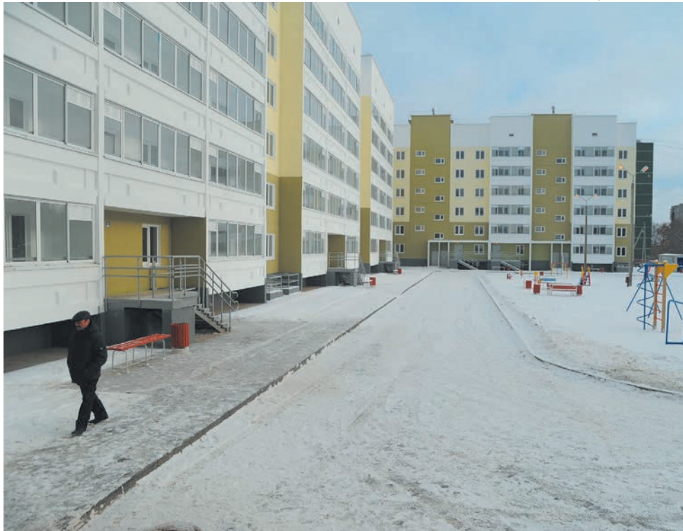
Новый дом рассчитан на 216 семей

До новоселья семья Моисеевых, в которой двое