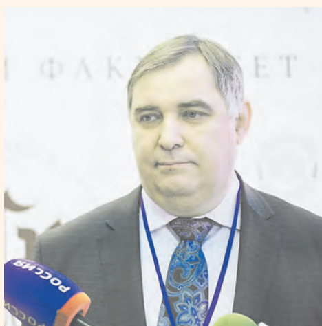
Игорь Макарихин — ректор Пермского государственного национального исследовательского университета