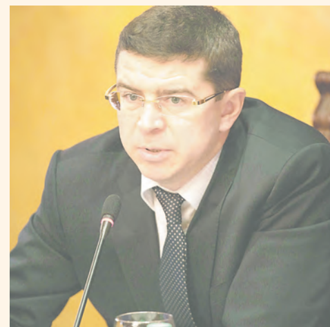
Константин Беляев — заместитель председателя Арбитражного суда Свердловской области, председатель окружного совета Ассоциации юристов России в Уральском федеральном округе