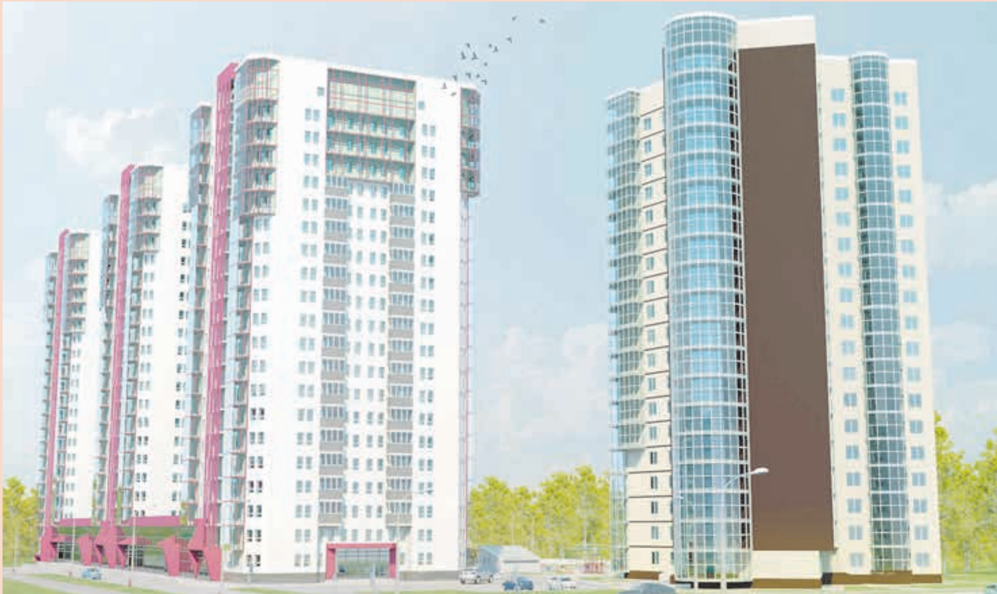
Так будет выглядеть ЖК «Солдатская слободка», возводимый компанией «СтройПанельКомплект» в историческом центре Перми, на пересечении улиц Пушкина и Николая Островского

Если в Мотовилихе в ближайшие пять-семь лет не будет построена дорога согласно Генеральному плану Перми, прогрессивного развития не получится.