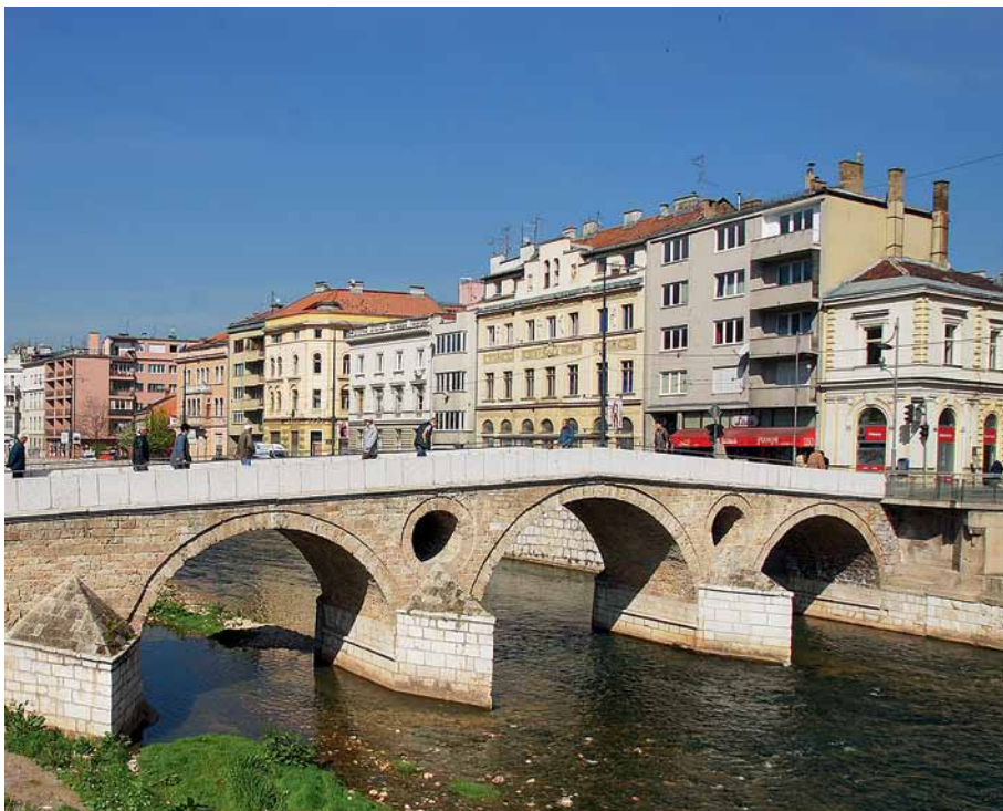
Мост в Сараево, на котором был убит герцог Фердинанд в 1914 году