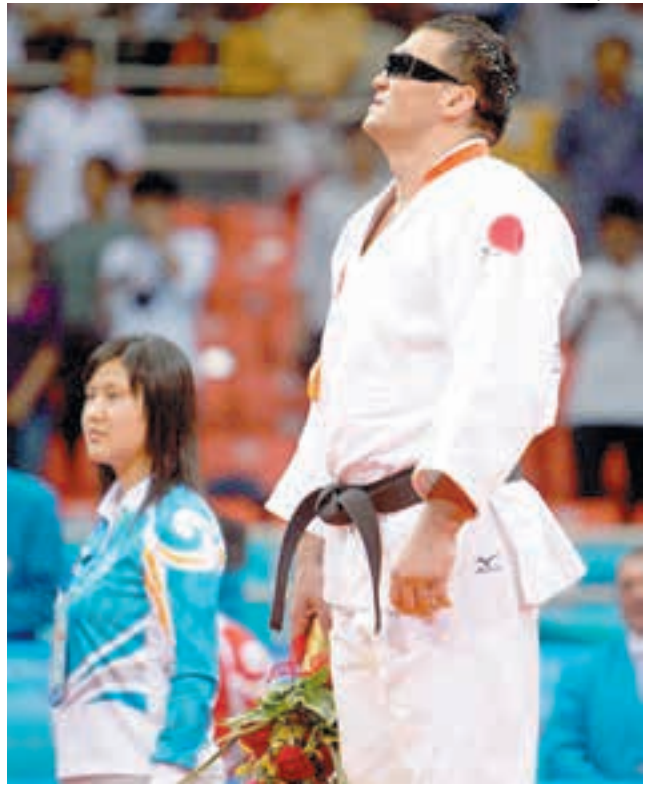
Олег Крецул — паралимпийский чемпион

В основном правила в дзюдо для зрячих и незрячих спортсменов одинаковы. Разница только в том, что дзюдоисты с ограниченными возможностями по зрению перед началом схватки захватывают ги (кимоно) соперников. Также есть подразделения среди участников по степени слепоты. Тотально слепые относятся