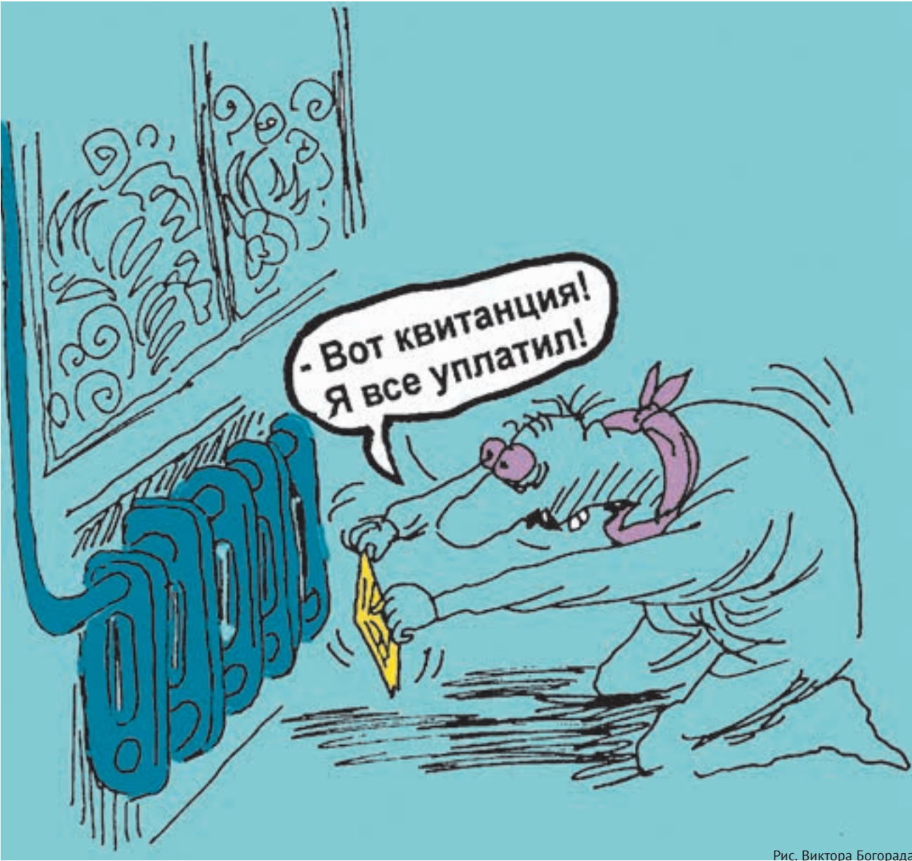
Рис. Виктора Богорада