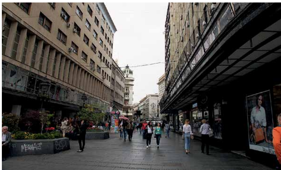
Главная улица Белграда