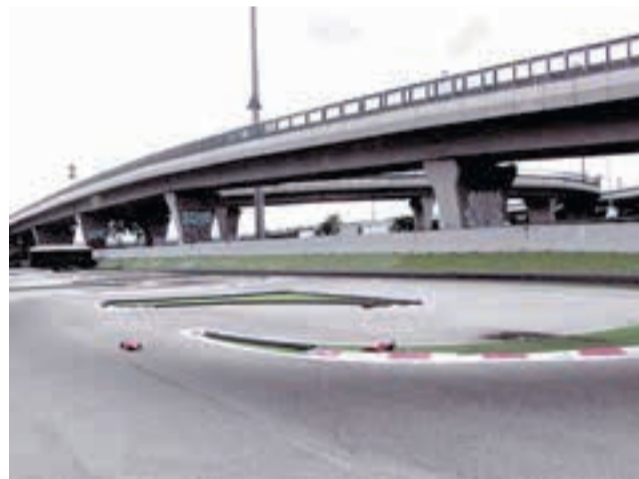
Пермский театр юного зрителя, 21 сентября, 19:00

Римская кольцевая дорога — самая длинная автомагистраль Италии, огибающая столицу. Более двух лет режиссер кружил вокруг Рима по Большому дорожному кольцу, чтобы изучить ментальные миры и вариации будущего, скрытые в городской суматохе. За каждым изгибом дороги — возникающие и исчезающие мимолетные видения. Наблюдая за горожанами, режиссер создает трагикомическую галерею реальной жизни и движения времён.