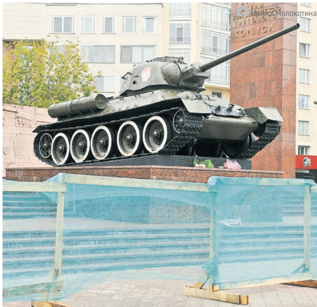
Мемориал Уральскому добровольческому танковому корпусу отремонтируют к концу октября

В этом году будет отремонтировано 16 памятников, которые одновременно являются объектами культурного наследия: 10 находятся в муниципальной собственности, ещё шесть — бесхозные, по