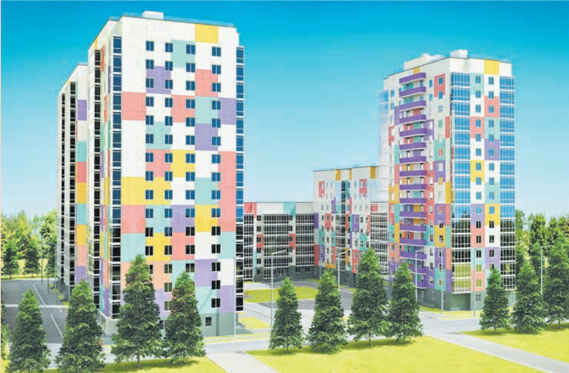
Набирает темпы строительство ЖК «Аврора» на ул. Крупской, 67 (девелопер проекта PAN City Group)

Сейчас на рынке новостроек предлагается более 80 новых объектов, подсчитали в PAN City Group. Всё большие темпы набирает строительство ЖК «Аврора» на ул. Крупской, 67 (девелопер проекта PAN City Group), где строительные работы идут на уровне шестого этажа. Наконец-то начато строительство ЖК «Спортивный микрорайон «Ива» (застройщик «Девелопмент-Юг»), предложение недавно выведено