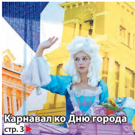
Карнавал ко Дню города стр. 3