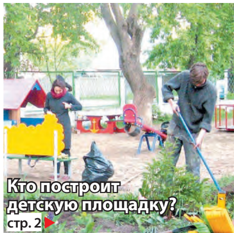
Кто построит детскую площадку? стр. 2