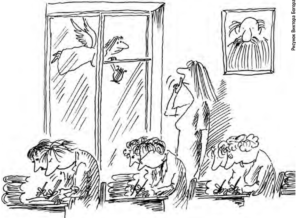
Рисунок Виктора Богорада