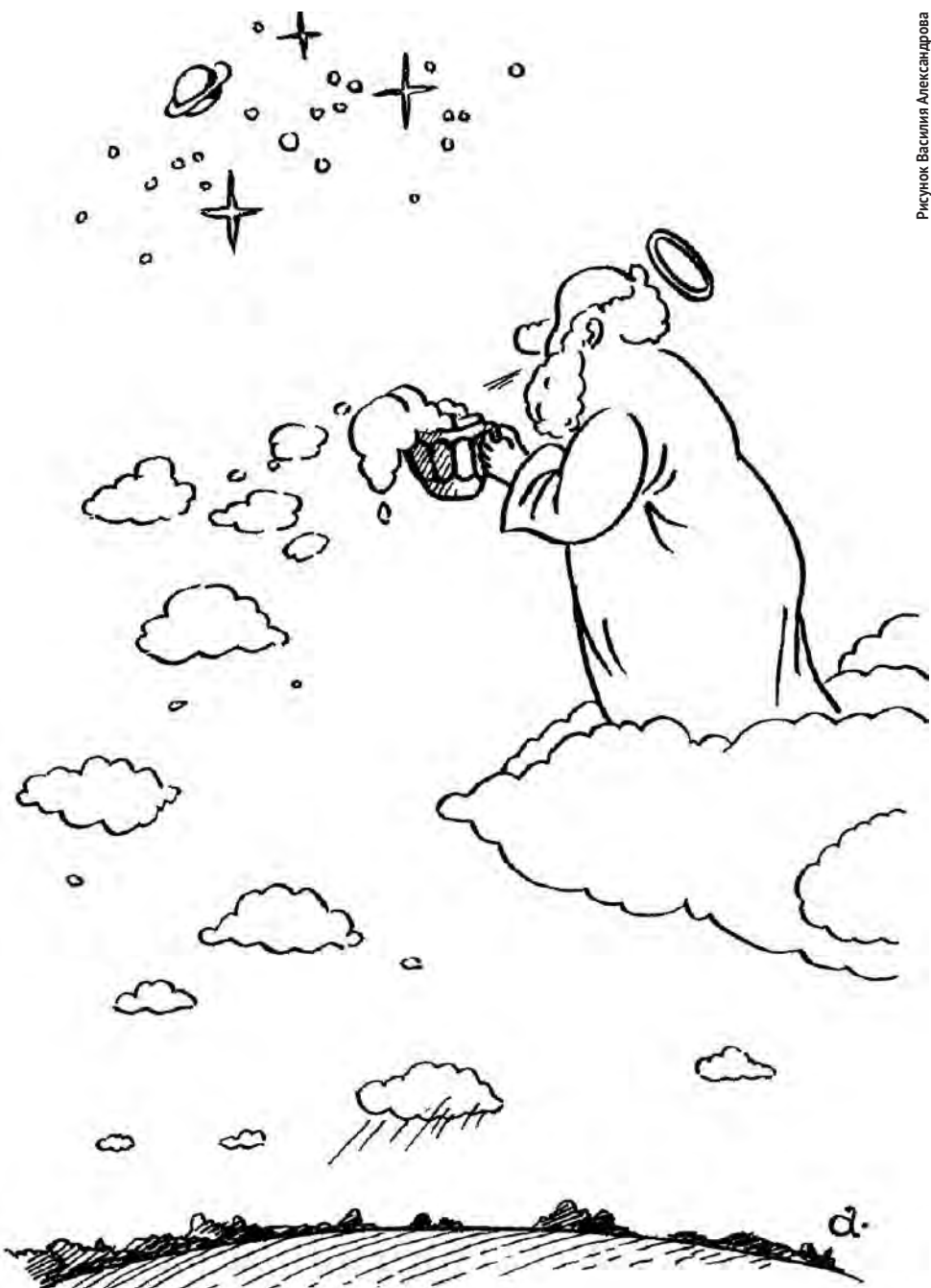
Рисунок Василия Александрова

* Сбережения принимаются на основании займа от 30000 руб. на срок от трёх месяцев. Досрочное расторжение договора допускается в случаях, предусмотренных законом. При расторжении договора по инициативе займодавца 3% начисляются в размере 2% годовых. Займы принимаются на основании ГК РФ в соответствии с условиями договора займа ООО «РуссИнвестГрупп». Св-во ОГРН №1137746412330. Предложение не является публичной офертой. Реклама.