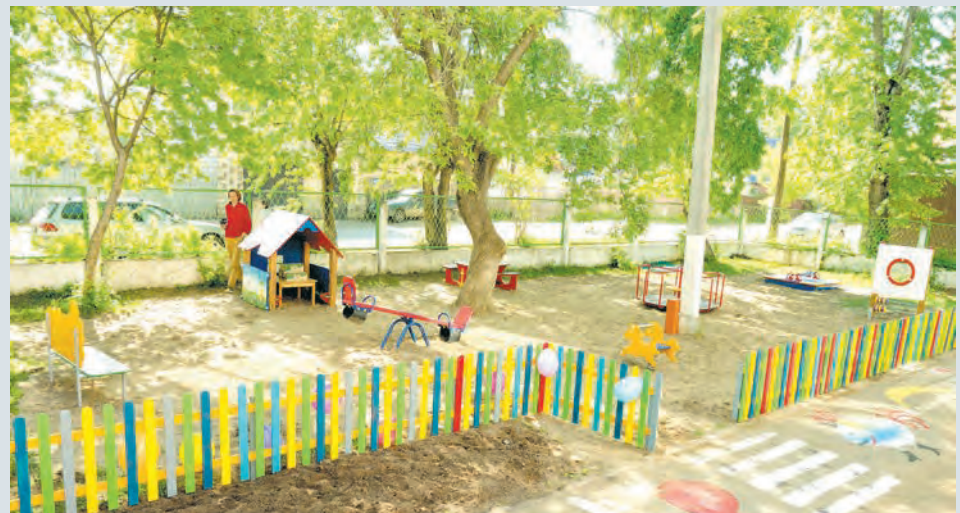
Так теперь выглядит площадка у социально-реабилитационного центра «Доверие»

Это лишь первая детская игровая площадка, которая в этом году появилась в Пермском крае по инициативе благотворителей. В планах фонда «Дедморозим» обустроить территории детдомов и приютов в других городах Прикамья.