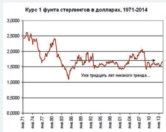
Рис. 2. Инвестиции в валюту — цена британского фунта в долларах с 1971 года по наши дни. На больших периодах такая «инвестиция» ничего не даёт — цена на валюту не меняется.

которые подчиняются экономическим законам (вспомните 2008 год, когда «все убежали в доллар»).