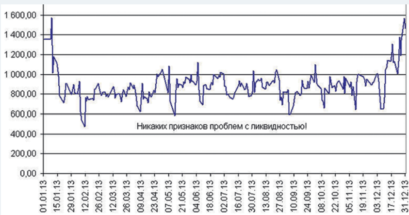
Рис. 4. Остатки на коррсчетах кредитных организаций в 2013 году (данные с сайта ЦБ). Денег у банков стабильно достаточно для поддержания ликвидности.

в прежнее десятилетие, но не сегодня. Как следствие, большинство банков стало осторожнее относиться к своей финансовой устойчивости, меньше рассчитывать на межбанк, а значит, и меньше зависеть от паники и «чёрных списков». Вот почему «кризис» 2013 года никак не отразился на показателях ликвидности: он был исключительно политическим и не затронул реально работающих банков.