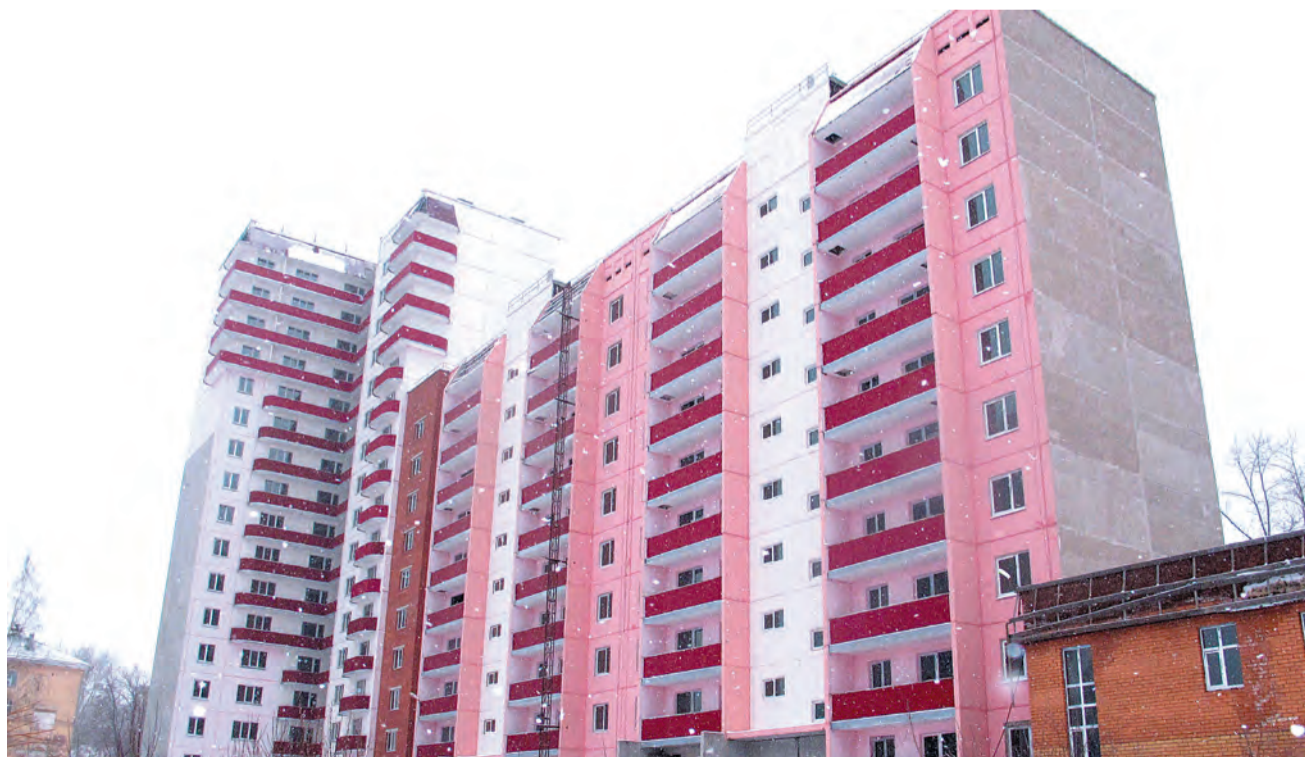
Принято окончательное решение о завершении строительства дома на ул. Ушакова, 21 силами ОАО ПЗСП