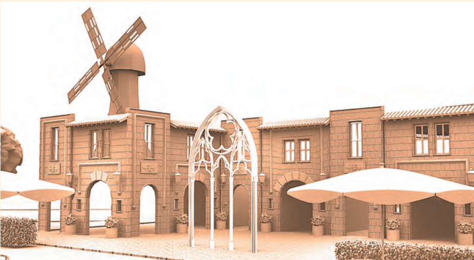
Мельница Дон Кихота