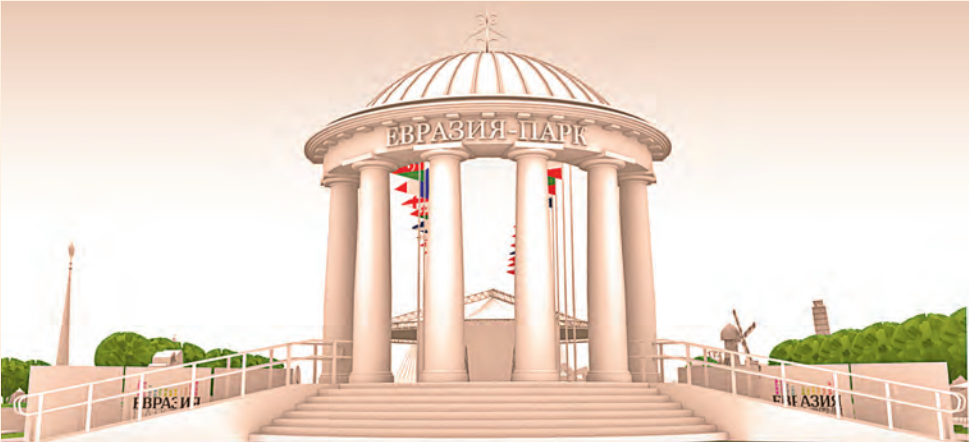
Вход со стороны ул. Попова