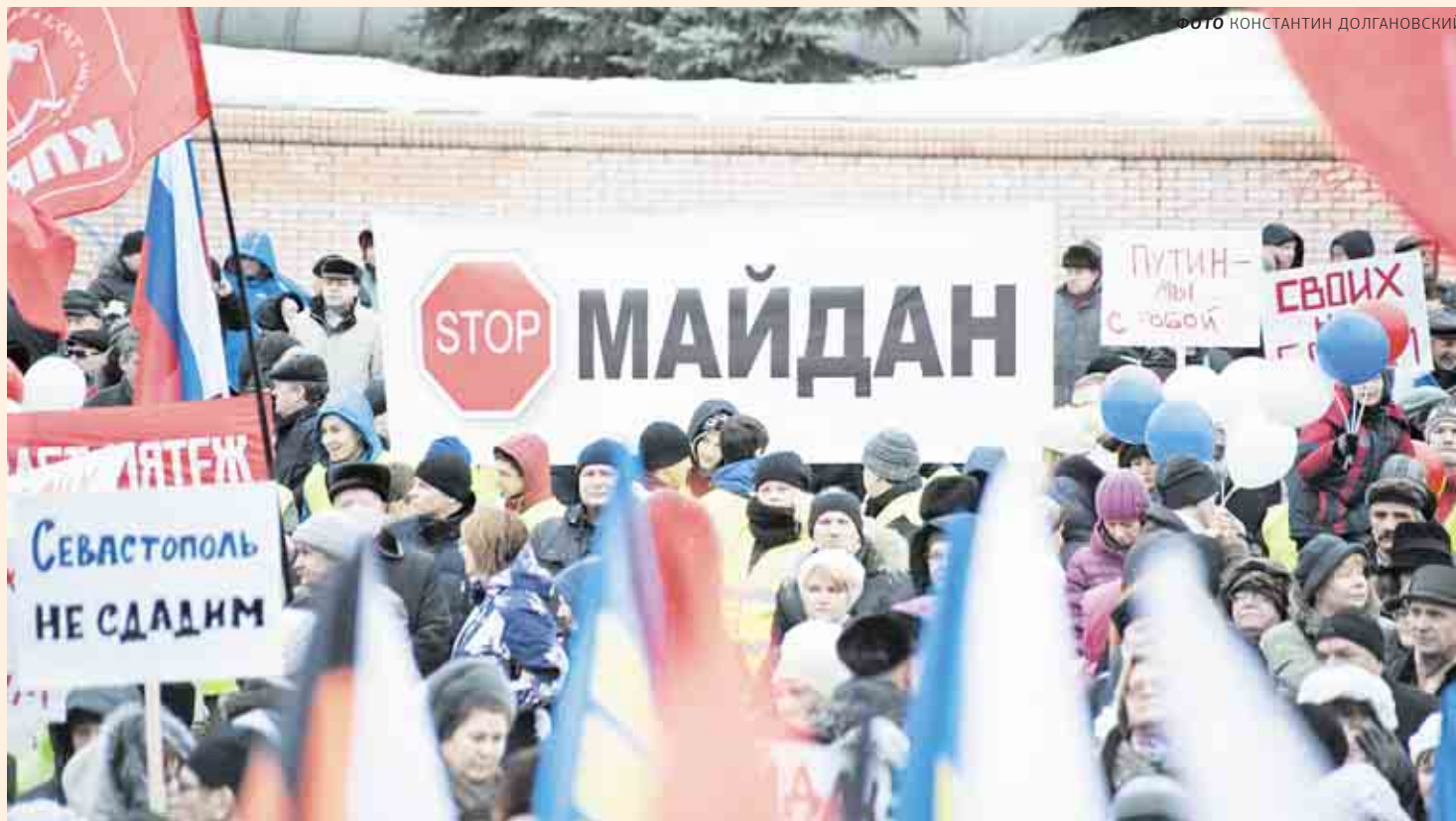
В Перми 10 марта состоялся народный сход «Своих не сдаём!» в поддержку российско-украинского братства, в котором, по официальным данным, приняли участие около 15 тыс. жителей Пермского края

Россия не одинока в своей борьбе против однополярного мира. На нашей стороне многие страны (в том числе и в Европе), которым такое мироустройство не подходит в принципе.