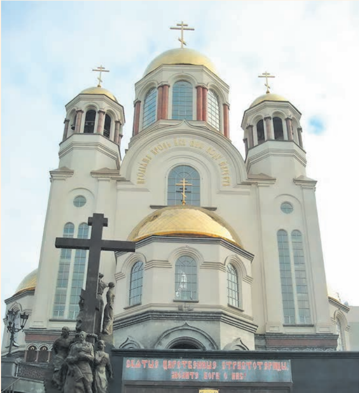
Туристический скородел на месте трагедии — «фарт» подземного суперклада (Храм-на-Крови, Екатеринбург)