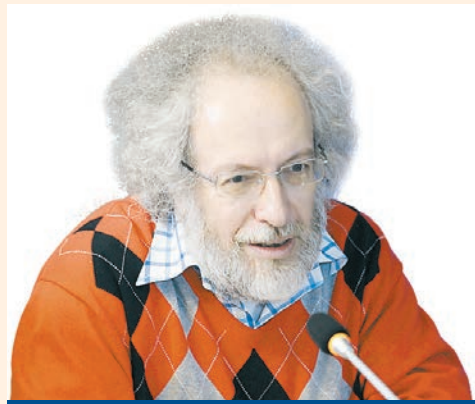
АЛЕКСЕЙ ВЕНЕДИКТОВ, главный редактор радио «Эхо Москвы»

Я не журналист, я — главный редактор. Я не чувствовал себя комфортно ни с одним руководителем страны — ни с Горбачёвым, ни с Ельциным, ни с Путиным, ни с Медведевым, ни опять с Путиным. Просто у нас разные работы. Моя работа — создавать критический настрой в отношении власти. Так я вижу роль прессы. Объясню, почему.