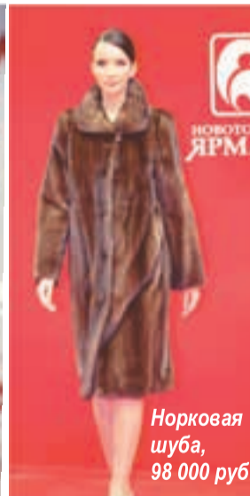
Норковая шуба, 98 000 руб.