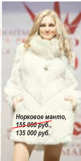
Норковое манто, 155 000 руб. , 135 000 руб.