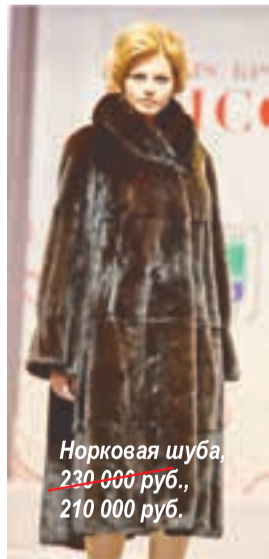
Норковая шуба, 230 000 руб. , 210 000 руб.

Изготовление Новоторжской норки — это целое искусство. Современные технологии потребуют не менее двух недель на пошив одного изделия! Для изготовления манто из 35 норок наборщик меха сортирует более 500 шкурок, прежде чем подберёт однородные по ворсу. Результат кропотливой работы — красивые норковые шубы по выгодной цене на Новоторжской ярмарке.