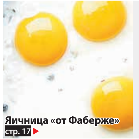
Яичница «от Фаберже» стр. 17