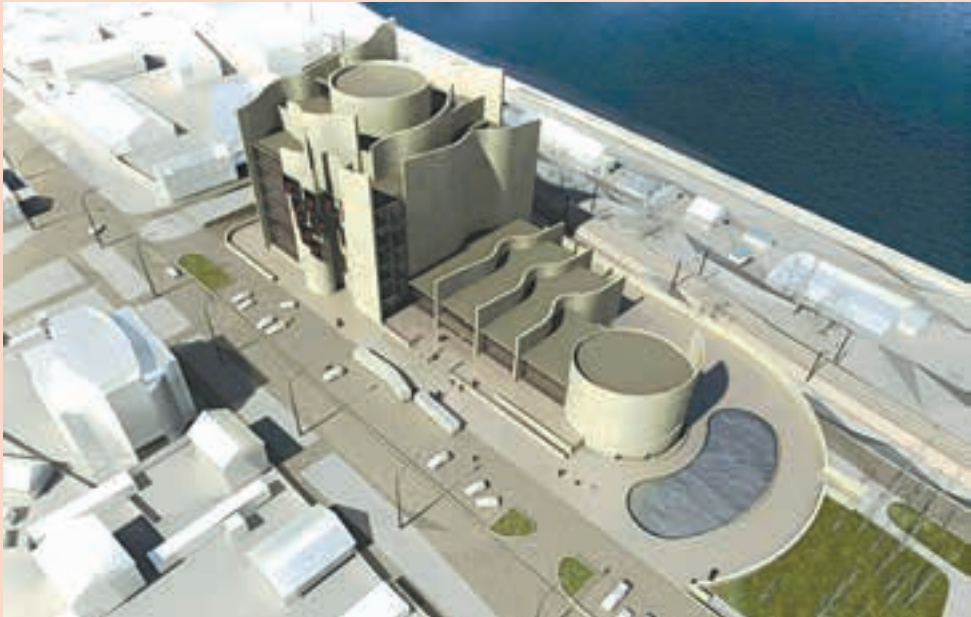
Щипалкин В. Проект Пермской государственной художественной галереи

Пермская государственная художественная галерея, 15 ноября 2013 года — 2 февраля 2014 года