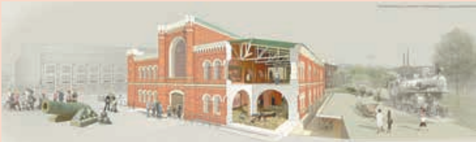
Лавриненко А. Организация пространства музейного комплекса «Пермские пушечные заводы с экспозицией в здании чугунолитейной фабрики»

Отдельный раздел на выставке посвящён истории музейного архитектурно-проектирования в Перми. Среди прочего архитекторы предложили разработки нового здания для Пермской художественной галереи.