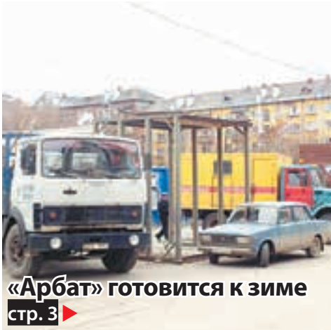
«Арбат» готовится к зиме стр. 3 ▶