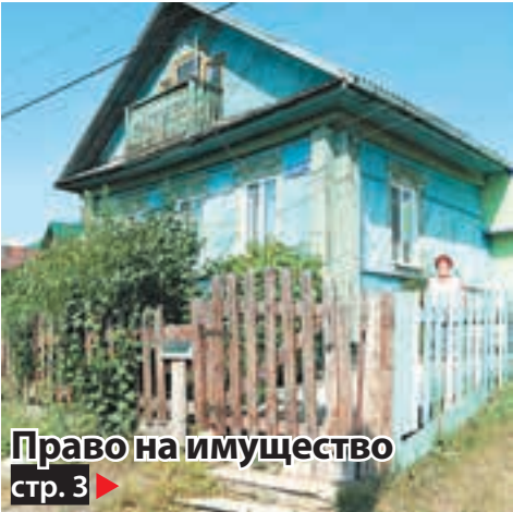
Право на имущество стр. 3 ▶