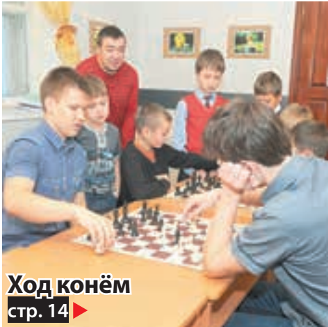
Ход конём стр. 14 ▶