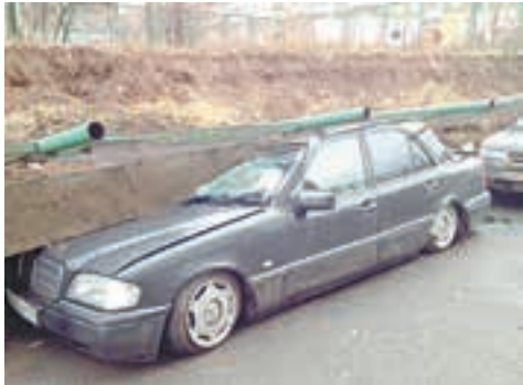
Забор разрушительной силы стр. 3 ▶