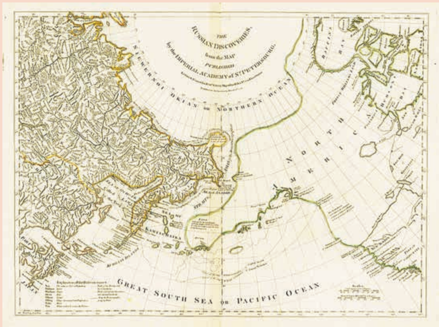
Карта Миллера. Пролив между Азией и Америкой. 1754 г.

Вторая Камчатская экспедиция состоялась в 1733-1743 годах. Благодаря этому легендарному путешественнику учёным удалось описать побережье Северного Ледовитого океана, открыть американский берег, подтвердить наличие пролива между Азией и Америкой, обследовать побережье Японии и совершить ещё множество значимых для всего мира открытий. Одной из точек по формированию отрядов экспедиции под руководством Витуса Беринга стал город Оса Пермского края.