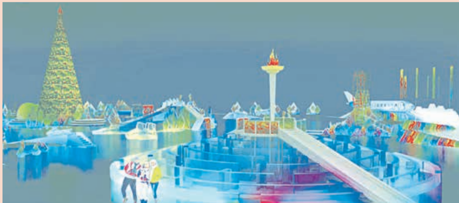
Эскиз Ледового городка от компании «Стенд-Арт», чей проект признан победителем в 2013 году

В общем, склонять очи долу и повиниться или хотя бы просто спускать всё на тормозах чиновники не хотят. А это значит, что ценителей «жареного» ждёт ещё много вкусного на муниципальной «сковородке». ■