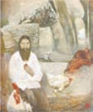
М. Нурулин. «Старец»

Пермская государственная художественная галерея, до 24 ноября