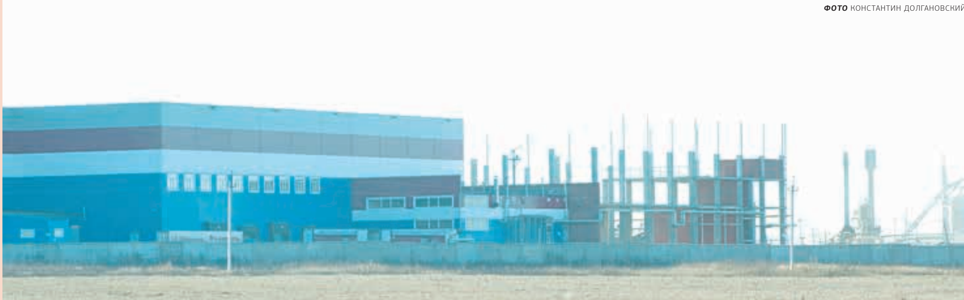
Одним из перспективных направлений сотрудничества с китайцами может стать строительство крупного логистического центра. На сегодня эта ниша в крае практически пуста