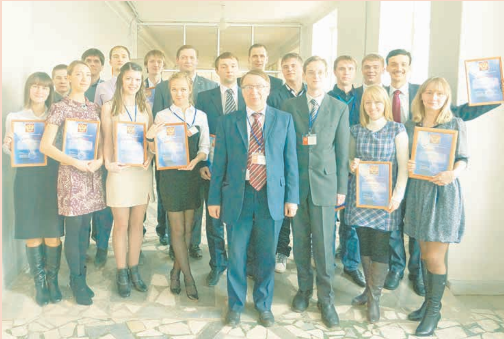
Финалисты весеннего конкурса «Умник-2012»