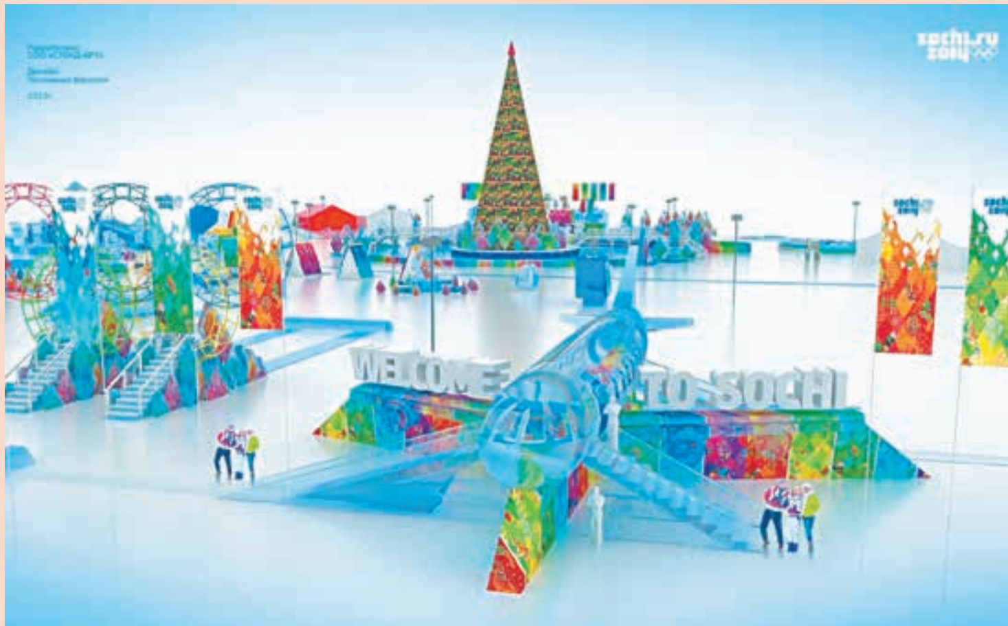
Эскиз Ледового городка от компании «Стенд-Арт», чей проект признан победителем в 2013 году