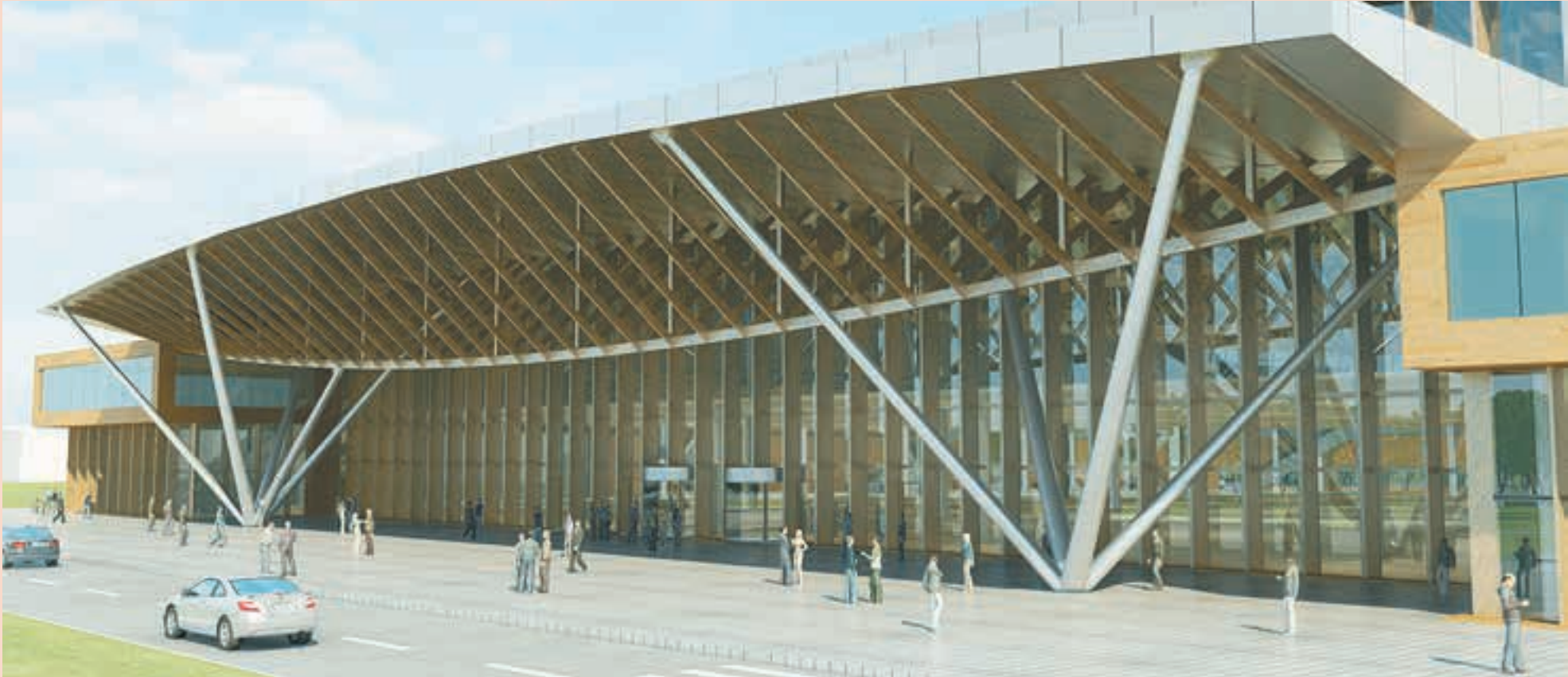
Эскиз входной группы в международный аэропорт «Пермь», предложенный архитектурным бюро Hintan Associates