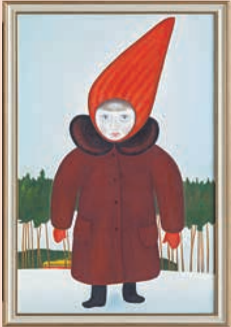
Александр Лысяков. «Девочка в красной шапочке»

Музей советского наива, 26 октября — 12 декабря